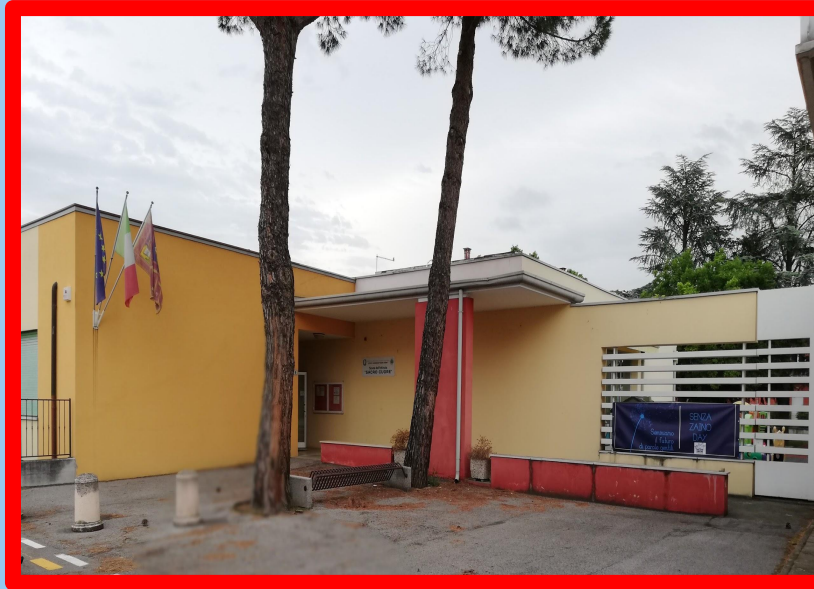
SCUOLA DELL'INFANZIA "S. Cuore" Ponte di Barbarano