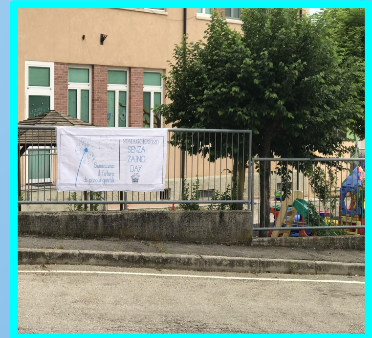
SCUOLA DELL'INFANZIA "S. Giuseppe" VILLAGA