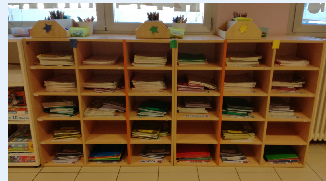
BUCHETTE PER LIBRI E QUADERNI